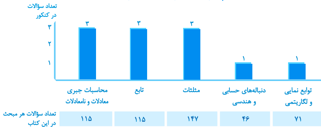
«مباحث پایه‌ی پیش‌نیاز برای ریاضی پیش‌دانشگاهی»

برای تسلط بر مباحث (پیش‌دانشگاهی)، باید بر برخی از مباحث پایه مسلط باشید، جدول زیر کاربرد فصل‌های پایه را در مباحث پیش‌دانشگاهی نمایش می‌دهد.