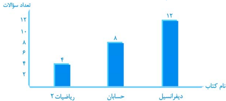
«سهم کتاب‌های درسی در کنکور سراسری»

بخش پایه‌ی این کتاب شامل ۵ فصل است. این بخش در کنکور سراسری، شامل ۱۰ سؤال است که در این کتاب ۱۱۲۳ تست آورده شده است. بنابراین به‌طور میانگین به ازای هر سؤال، حدود ۱۱۰ تست برای تمرین شما موجود است. نمودار زیر، میانگین سهم سؤالات هر مبحث را در کنکور سراسری مشخص می‌کند. تعداد سؤالات هر مبحث بر اساس اهمیت نسبی آن در کنکور تعیین شده است.