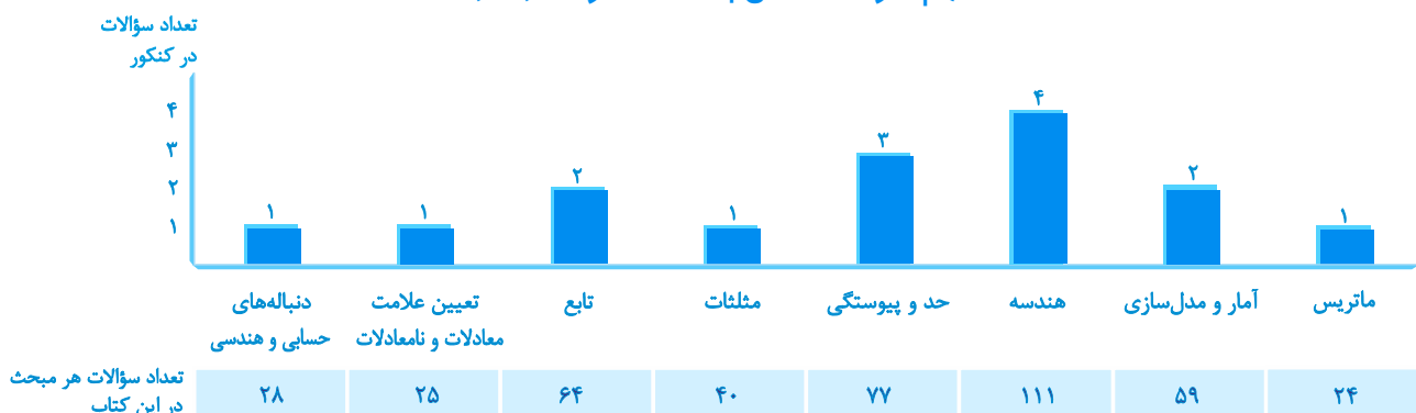
«مباحث پایه‌ی پیش‌نیاز برای ریاضی پیش‌دانشگاهی»

برای تسلط بر مباحث (پیش‌دانشگاهی)، باید بر برخی از مباحث پایه مسلط باشید، جدول زیر کاربرد فصل‌های پایه را در مباحث پیش‌دانشگاهی نمایش می‌دهد. سه فصل هندسه، آمار و ماتریس فصل‌های مستقل پایه هستند.